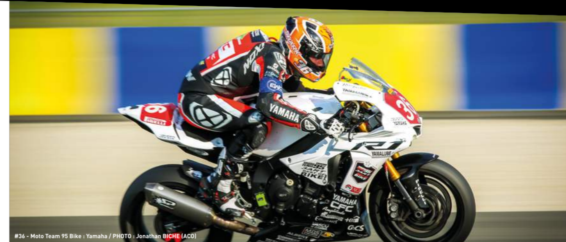
#36 - Moto Team 95 Bike : Yamaha

de grandes ambitions. L'équipe autrichienne aura à cœur de se rappeler au bon souvenir de 2009 lorsqu'elle avait remporté la classique mancelle. Broc Parkes, Marvin Fritz et Niccolò Canepa se partageront le guidon de la Yamaha #7. Honda sera également représenté par l'équipe britannique Honda Endurance Racing. Deuxième du classement général l'an passé, elle compte bien gravir une marche supplémentaire. Enfin, BMW accentue son effort en FIM EWC. Le constructeur allemand compte sur une nouvelle version de S1000RR et l'équipe allemande ERC-BMW Motorrad Endurance (ex NRT48) pour décrocher son premier succès aux 24 Heures Motos.