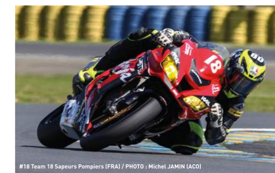
#18 Team 18 Sapeurs Pompiers (FRA)

vainqueurs de grand prix) et Hugo Clere. Victorieuse au Bol d'Or, l'équipe allemande Gert56 German Endurance Racing Team voudra surfer sur la vague du succès. Dauphin de 3ART Moto Team 95 en 2018, le team Moto Ain fera le déplacement en Sarthe pour gagner après deux deuxièmes places consécutives.