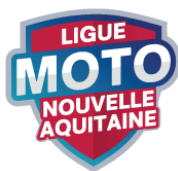
Visa Ligue LMNA