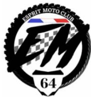
Visa EMC 64

Article 20 : Le Pays Basque pour les nuls - Leçon 4, sera programmée en septembre 2027.